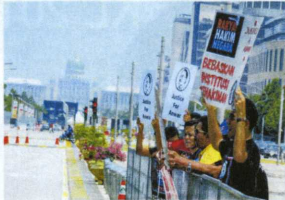
HANYA beberapa orang penyokong Anwar masih datang memberi sokongan kepada Ketua Pembangkang itu di Istana Kehakiman di Putrajaya semalam.