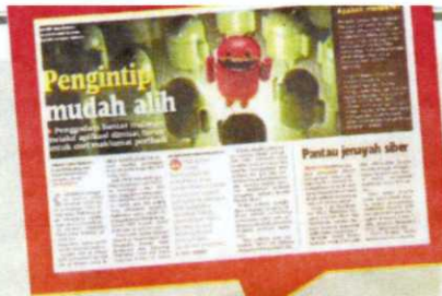
LAPORAN Harian Metro, semalam

"Kami nasihatkan pengguna Internet mempunyai perisian antivirus"